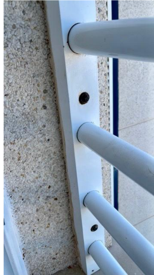
Después de tratamiento con G200 ÓXIDO