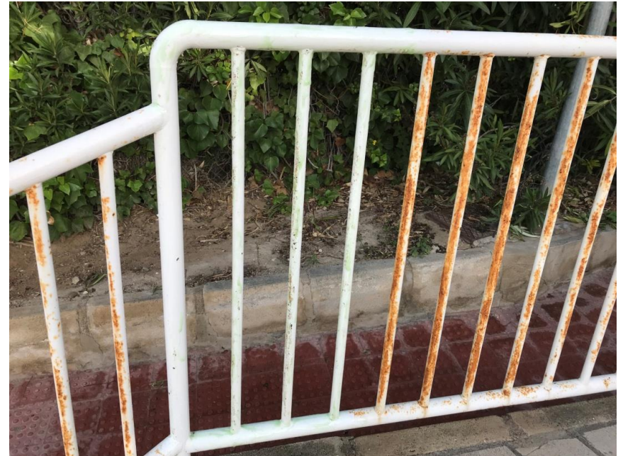
Después de tratamiento con G200 ÓXIDO