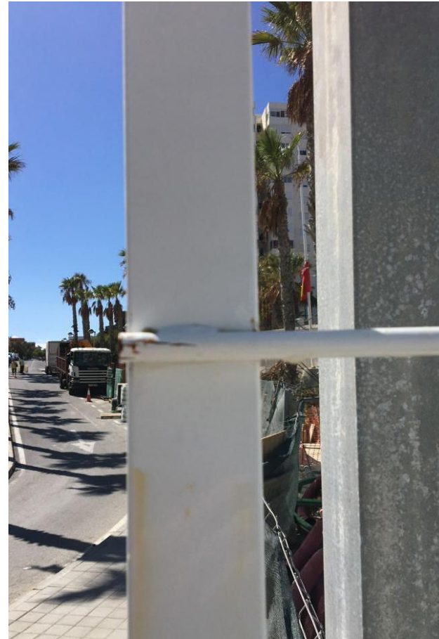
Después de tratamiento con G200 ÓXIDO