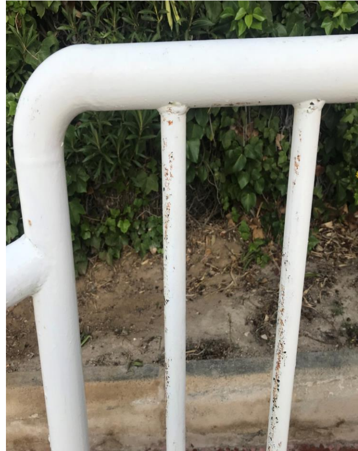
Después de tratamiento con G200 ÓXIDO