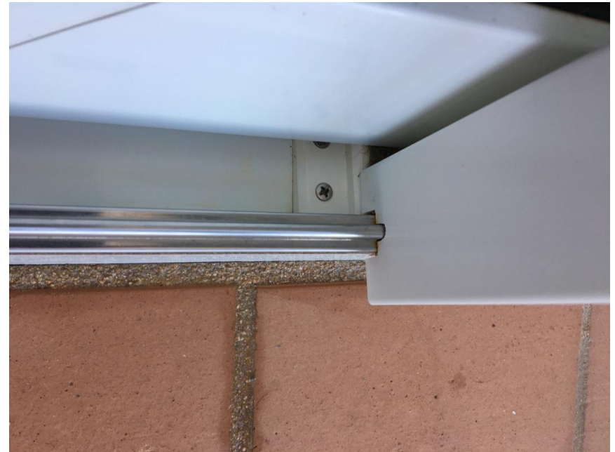
Después de tratamiento con G200 ÓXIDO