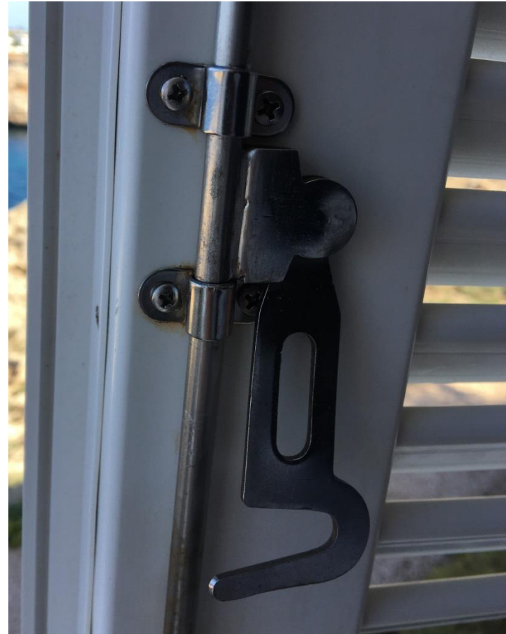
Después de tratamiento con G200 ÓXIDO