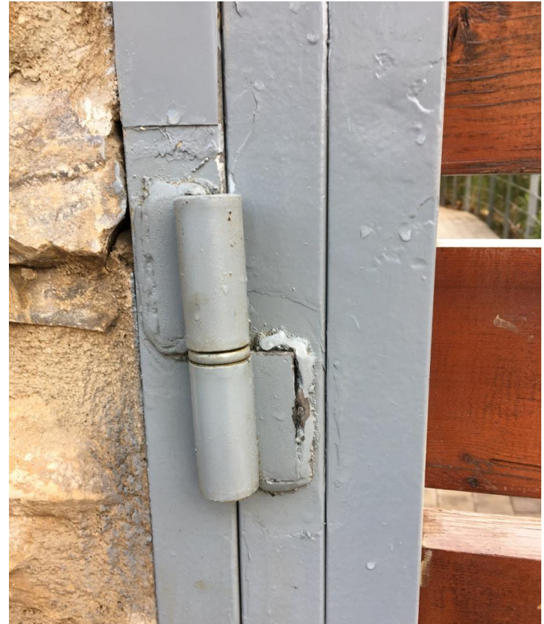
Después de tratamiento con G200 ÓXIDO