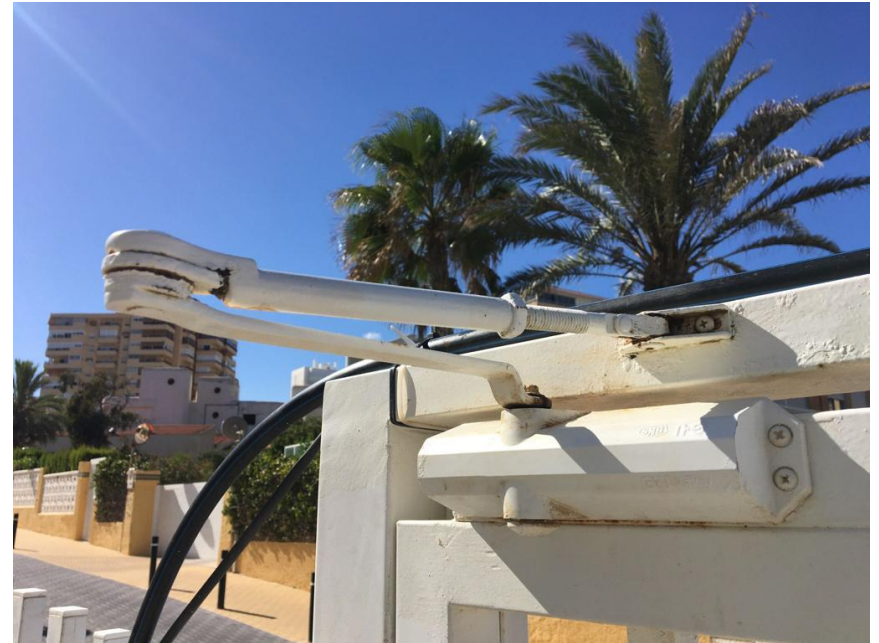
Después de tratamiento con G200 ÓXIDO