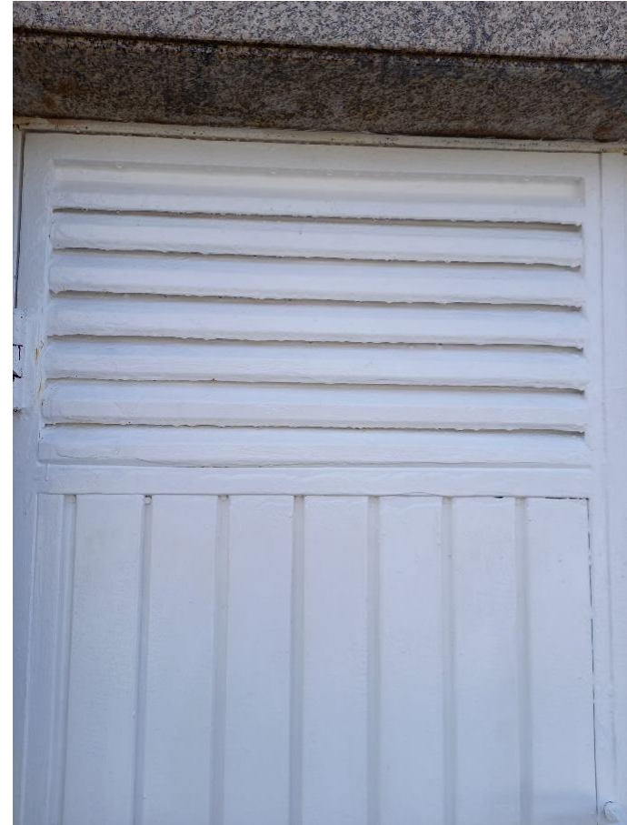
Después de tratamiento con G200 ÓXIDO