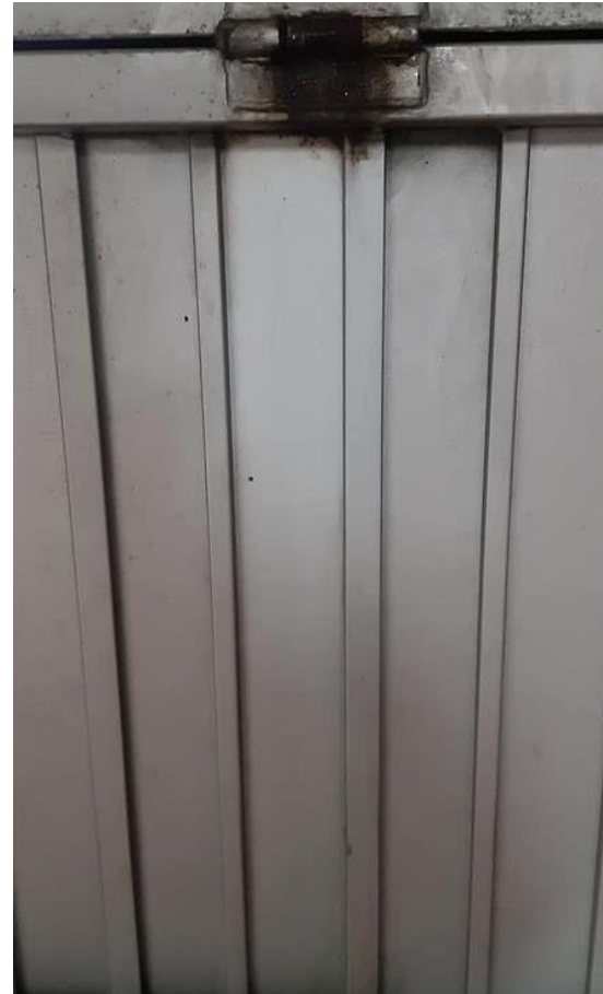
Después de tratamiento con G200 ÓXIDO