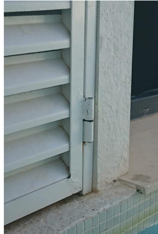
Después de tratamiento con G200 ÓXIDO