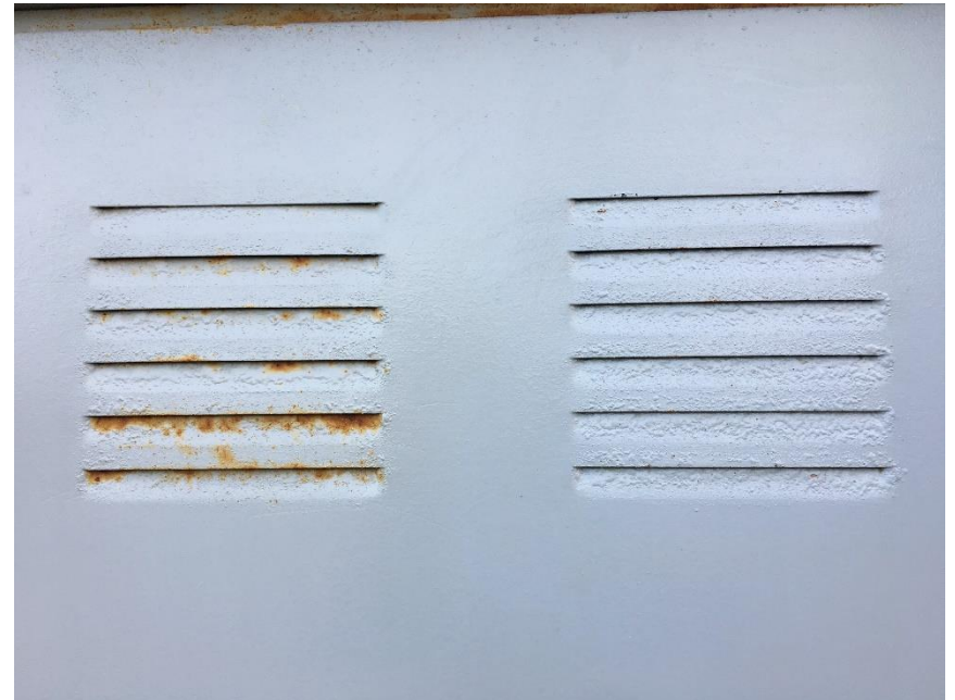
Después de tratamiento con G200 ÓXIDO