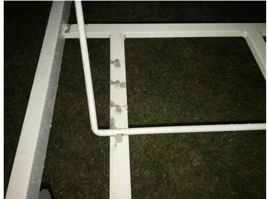
Después de tratamiento con G200 ÓXIDO