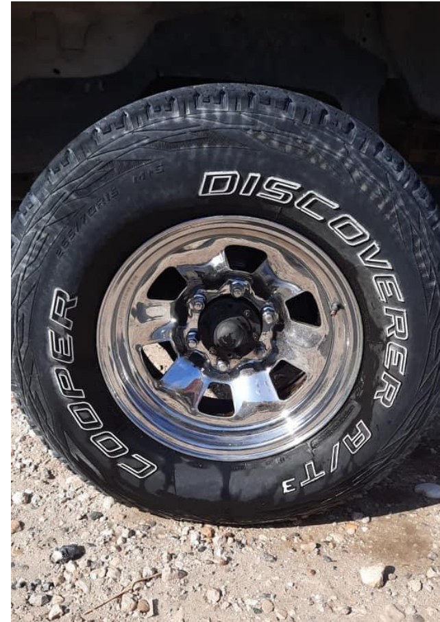
Después de tratamiento con G200 ÓXIDO