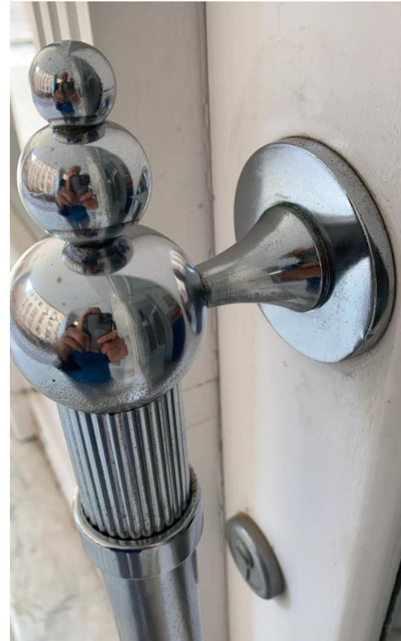
Después de tratamiento con G200 ÓXIDO