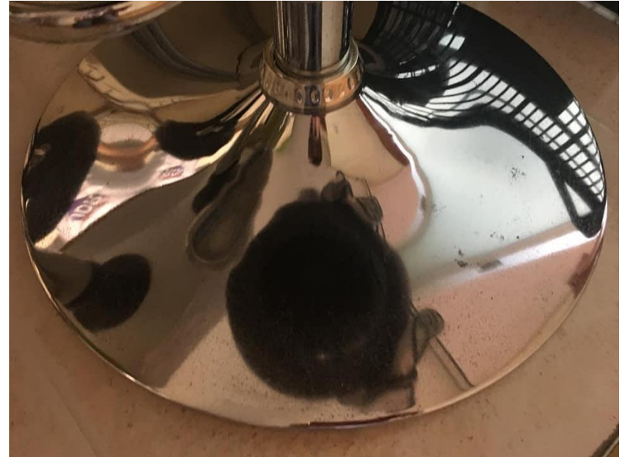
Después de tratamiento con G200 ÓXIDO